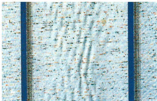
Beispiel Welligkeit im Bahnenbereich Exemple ondulation dans les zones des bords de lés Esempio ondulazioni sulla banda