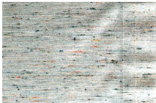
Beispiel Welligkeit im Nahtbereich Exemple ondulation dans les zones des coutures Esempio ondulazioni presso la cucitura