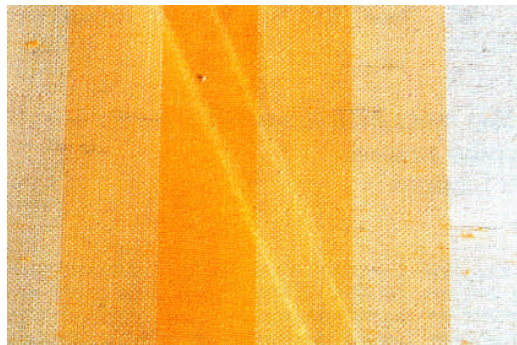
Beispiel Knickfalten Exemple froissures Esempio arricciature

Grundsätzlich treten all diese Effekte in unterschiedlichen Stärken bei fast allen Markisentüchern auf. Sie mindern aber in keiner Weise die Qualität der Tücher und berechtigen keinesfalls zu Garantieansprüchen.